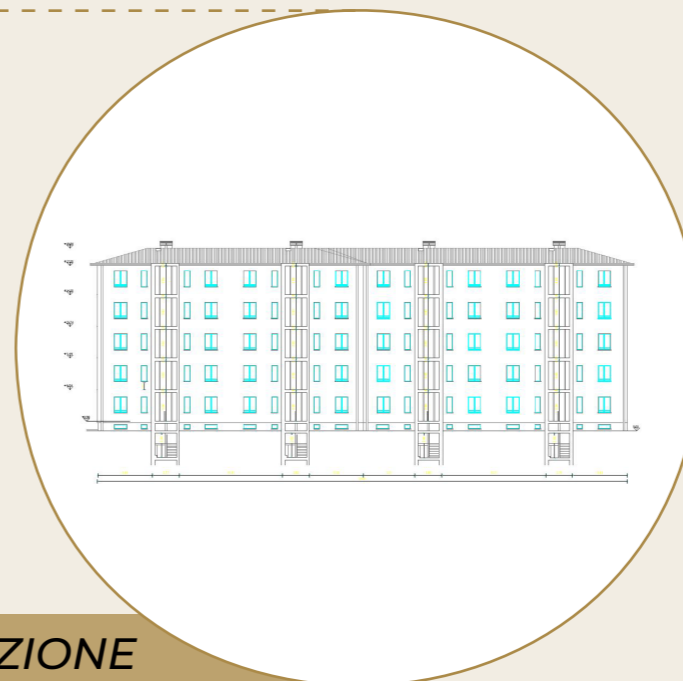
PROSPETTO E SEZIONE