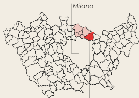
Sesto San Giovanni